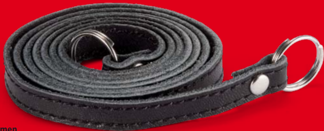
Ledertrageriemen Leather Carrying Strap

Sehr verehrter MINOX Kunde, vielen Dank für Ihr Vertrauen in die Marke MINOX. Um Ihnen einen individuellen Service bieten zu können, empfehlen wir Ihnen, Ihre MINOX Classic Camera unter www.minox.com/service zu registrieren. Gerne stehen wir Ihnen mit Rat und Tat zur Seite – ob mit Informationen oder anderen Services. Persönlich, schnell und vollkommen unkompliziert. Als kleines Dankeschön für Ihr Vertrauen senden wir Ihnen bei erfolgreicher Registrierung den zu Ihrer MINOX Kamera passenden Ledertrageriemen im Wert von 24,50 Euro kostenlos zu.